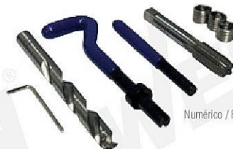
Númerico / Fraccional

Cada juego incluye broca, machuelo STI para inserto helicoidal, insertos y herramienta para instalar y arrastrar